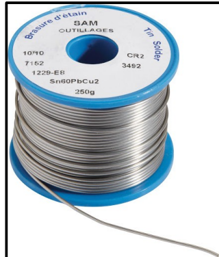
Bobine pour braser