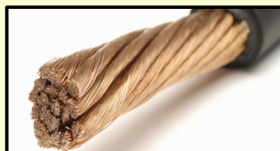
Fil électrique torsadé

3 – Torsader chaque extrémité des fils électriques.