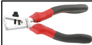
Pince à dénuder

Matériel nécessaire pour préparer l'activité